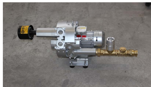
surpresseur à canal latéral